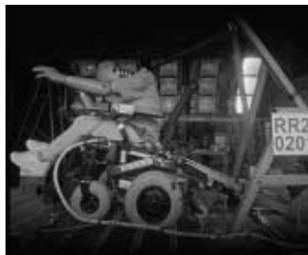
Abb. 10 Auch unter dynamischer Belastung verändert sich der Gurtverlauf kaum.

Abb. 6 zeigt einen SPRINT GT von MEYRA mit entsprechenden Haltevorrichtungen. Während vorn am Querträger der Vorderachse Befestigungsschlaufen angebracht sind, ermöglichen hinten stabile Stahlbügel am Sitzrahmen die getrennte Befestigung von PRS-Sicherheitsgurten und RRS-Rückhaltgurten entsprechend der Norm (Abb. 7).