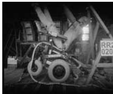
Abb. 11 Rollstuhl mit Dummy beim „Rebound“, dem Zurückschnellen des Prüfmusters nach Stillstand der Prüfplattform.

Abb. 7 zeigt den SPRINT GT mit normgerechter Gurtgeometrie. Verwendet werden die Kraftknoten-Elemente der Fa. AMF. Die Prüfung