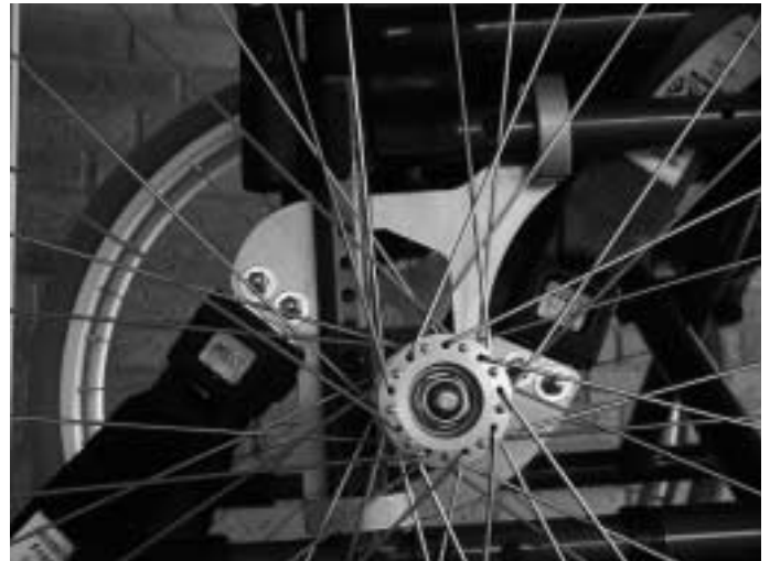
Abb. 4 Kraftknoten der Fa. AMF-Bruns mit vier Anschraubelementen, die die Gurtzungen tragen.

stuhlkonstruktion für den Behindertentransport, sowohl von manuellen als auch von Elektrorollstühlen. Die Neufassung der DIN-Norm 75078 wurde zum 1.10.1999 verabschiedet [2] und beschreibt seitdem den Stand der Technik, an dem sich ausgeführte Systeme messen lassen müssen. Weiterhin wurde zwischenzeitlich das von der Europäischen Kommission finanzierte Forschungsvorhaben TRANS-WHEEL abgeschlossen. Im Rahmen dieses Forschungsvorhabens [1, 7] wurde ein Elektrorollstuhl entwickelt, der als Sitz für behinderte Autofahrer die gleichen Sicherheitsstandards wie ein konventioneller Autositz erfüllt. Die Ergebnisse dieses Projektes lieferten die Grundlagen für Verbesserungen an den unten beschriebenen Serienrollstühlen.