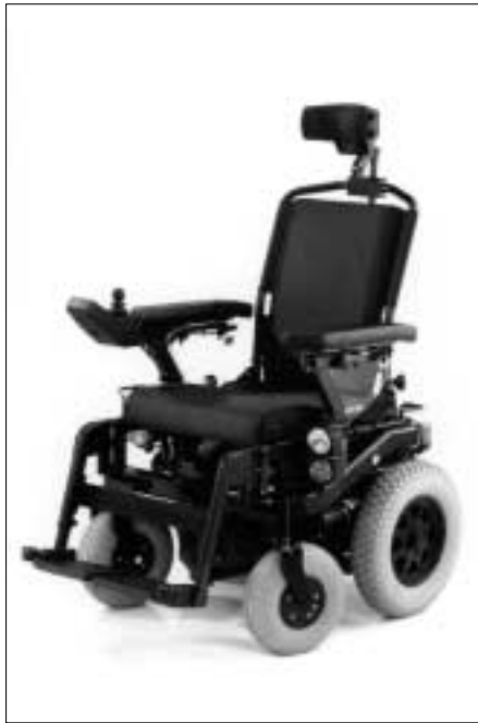
Abb. 6 Der Elektro-Rollstuhl SPRINT GT (MEYRA) mit Haltevorrichtungen.

Die Gurtgeometrie ist umso besser gewährleistet, je näher der Kraftknoten an den sog. „R-Punkt“ rückt. Der R-Punkt ist der angenommene Drehpunkt zwischen Oberkörper und Rumpf. In der Praxis ergeben sich Probleme, diesen Punkt zu treffen, da er einerseits von den Körpermaßen des Rollstuhlfahrers (und seiner Kleidung) abhängt, andererseits in diesem Bereich des Rollstuhls das Seitenteil angeordnet ist. Versuche haben gezeigt, dass Maßverschiebungen, wie sie in der Skizze bereits angedeutet und in der Praxis unumgänglich sind, recht unkritische Gurtwinkelveränderungen ergeben.