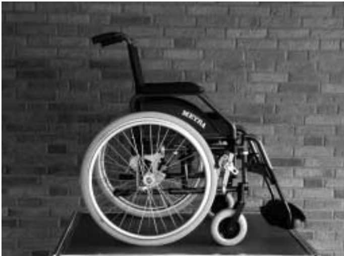
Abb. 3 Der MEYRA EUROCHAIR.