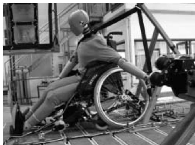
Abb. 9 Beschädigungen nur an der Verrastung der Beinstützen und der Verschraubung der vorderen Kastorbuchsen.

rungen an das Rollstuhlrückhaltesystem, das beim „Normcrash“ mit dem 16- bzw. 22-fachen des Eigengewichts von Rollstuhl und Fahrer (DIN oder ISO-Test) belastet wird. Dies entspricht einer Kraft in der Größenordnung von rund 20.000 N (oder einer „Gewichtskraft“ von rd. 2 t).