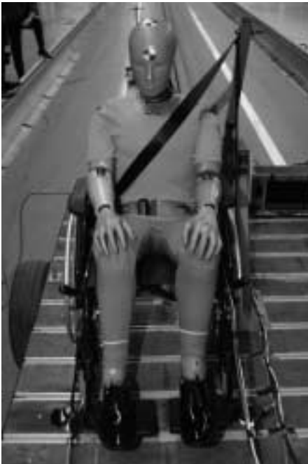
Abb. 5 Der Schultergurt ist Teil des Behindertentransportfahrzeuges.

träglich an den Rollstuhl angebracht werden kann.