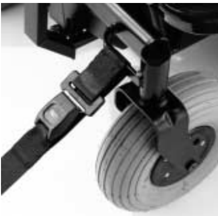
Abb. 7 Der SPRINT GT mit normgerechter Gurtgeometrie.